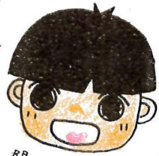
陽だまりの会 陽だまりおくん